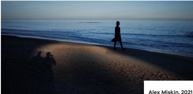
Alex Miskin, 2021

The museum develops physical and virtual exhibitions. Feminist museum pedagogy modules and cultural activity concepts in the exhibitions are must-haves. Each project of the museum opens up alternative spaces for discussing gender roles in various fields such as in women's history, politics, education, work, culture, art and the climate crisis. The projects engage people and communities in debate, collaboration and social interaction, by using feminist pedagogy approaches for feminist interaction and feminist knowledge transfer.